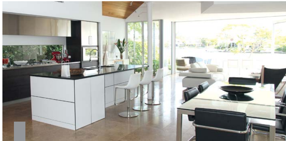
Die Vermietung möblierter Wohnungen hat Vorteile für Mieter und Vermieter.

Die Vermietung möblierter oder teilmöblierter Wohnungen wird immer beliebter, zum Beispiel, um den Umzug für alte und neue Mieter zu vereinfachen oder weil das Angebot dem Trend zum temporären Wohnen folgt. Vermieter sollten sich aber genau erkundigen, welchen Aufschlag sie für die Möblierung berechnen, wenn sie steuerliche Vorteile erzielen wollen. In einem Fall vor dem Bundesfinanzhof (BFH, Az. IX R 14/17) hatten Eltern ihrem Sohn eine teilmöblierte Wohnung vermietet. Darin befanden sich eine neue Einbauküche, eine Waschmaschine und ein Trockner. In ihrer Steuererklärung machten sie Einkünfte aus Vermietung und Verpachtung geltend. Sie unterließen es, für die vermieteten Geräte die ortsübliche Vergleichsmiete gesondert anzugeben, berücksichtigten die überlassenen Gegenstände jedoch nach dem Punktesystem des Mietspiegels. Das Finanzamt erkannte die Werbungskostenüberschüsse nicht in voller Höhe an, weil es von einer verbilligten Vermietung der Wohnung ausging. Laut BFH ist bei der Überlassung von Möbeln immer auch ein Möblierungszuschlag anzusetzen.